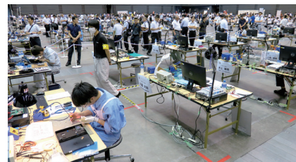
若年者ものづくり競技大会 (電子回路組立部門)

ものづくりを学ぶ全国の高校生が学習成果の発表の場として技術・技能を競う。電子回路組立部門は、設計仕様に沿った入力回路を設計・製作し、規定の動作をおこなう制御プログラムを競技時間内に完成させる。