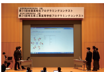
全国高校生 プログラミングコンテスト

1980年から経済産業省が主催してきた「U-20プログラミング・コンテスト」が2014年に民間へ移行、U-22プログラミング・コンテスト実行委員会は、一般社団法人コンピュータソフトウェア協会(CSAJ)に事務局を置く。応募資格が22歳以下に広がり、さまざまなジャンルのソフトウェア作品が集まる。