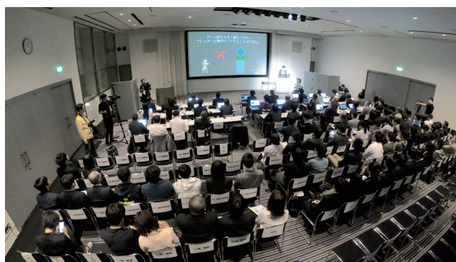
U-22プログラミング・コンテスト

競技・課題・自由の3部門でプログラミング作品の独創性や実用性、完成度を競う。課題・自由部門は、展示に加えプレゼンテーションやデモンストレーション審査がある。