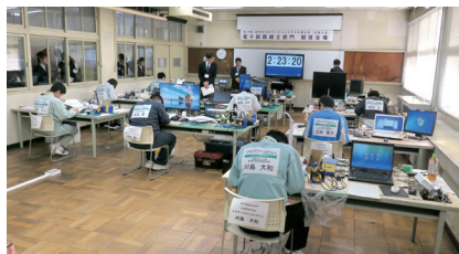
高校生ものづくりコンテスト全国大会 (電子回路組立部門)

主に工業高等学校の情報技術系学科の生徒たちが参加する伝統あるコンテスト。近年はネットワーク対戦競技「CHaser」で勝負を競っている。